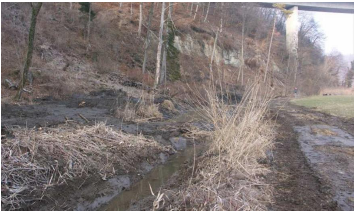
Abb. 3: Entwässerungsgräben können bei geeigneter Bewirtschaftung als Laichgewässer und Ausbreitungskorridore für Unken dienen.

Da die Adulttiere relativ austrocknungsgefährdet und möglicherweise hitzeempfindlich sind, können im Idealfall Entwässerungsgräben wie eine Kette von Fortpflanzungsgewässern als lineare Elemente für eine Vernetzung genutzt werden (Abb. 3). Dies ermöglicht einerseits ein höheres Überleben der Migranten, da sie nicht austrocknen, und kann andererseits die Wanderrichtung lenken, so dass die Tiere nicht in die Landschaft hinaus wandern und dort keinen geeigneten Lebensraum antreffen. Eine Aufwertung der Gräben durch Ausweitungen, Aufstau o.ä. wäre eine ideale Ergänzungsmassnahme, die wenig Platz erfordert, kostengünstig ist und in kurzen Abständen Fortpflanzungsgewässer schafft (vgl. Präsentation von Silvia Zumbach).