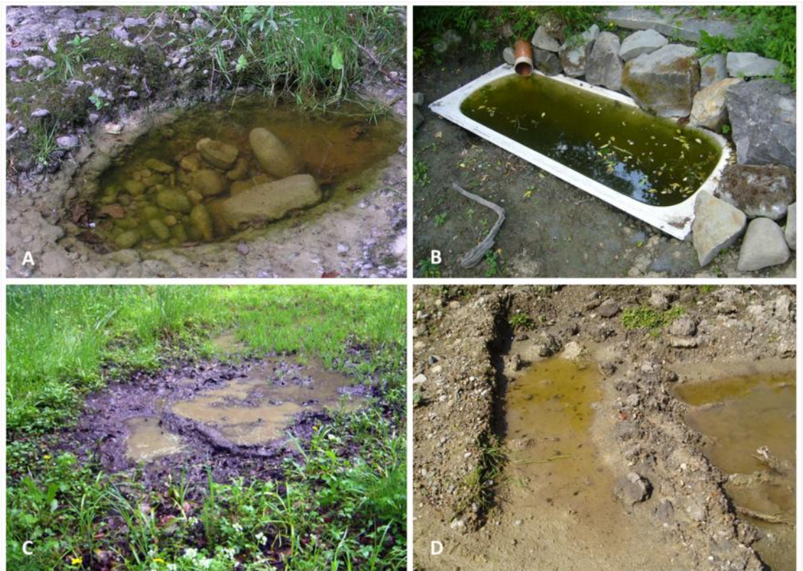
Abb. 4: verschiedene Unkengewässer. A: natürliche Steinkolke, B: Email-Badewanne mit Ablass, C: natürliche Hirschsuhle, D: Fahrspuren in einer Grube.

Von der Ansiedlung von Unken ist ganz klar abzuraten bzw. sie ist ohne Bewilligung auch nicht legal (vgl. dazu auch das karch-Merkblatt zur Wiederansiedlung 4 ). Jonas Barandun berichtete von einem Experiment, Unkenlarven gleich in die neu eingegrabenen künstlichen Wannen einzusetzen. Obwohl dieselben Wannen in bestehenden Populationen einen guten Reproduktionserfolg ermöglichten, konnte sich in keiner der vier Wannen mit Aussetzung eine Population etablieren. Die Entnahme von Larven führt zudem zu einer Schwächung der Quellpopulationen. Bei so geringen Erfolgschancen darf keine mögliche Schwächung von Quellpopulationen in Kauf genommen werden. Ausserdem besteht wie stets beim Transport von Tieren die Gefahr der Verbreitung von Krankheitserregern wie Chytridpilzen, Ranaviren oder weiteren, noch unbekannt Keimen (vgl. Vortrag von Benedikt Schmidt am Herpetokolloquium vom 6. Dezember 2014). Die Aussetzung infizierter Tiere widerspricht der Feisetzungsverordnung (FrSV; SR814.911). Zucht in Gefangenschaft birgt die allgemein in der