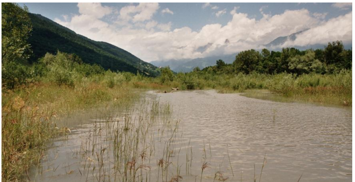
Abb. 5: Aufenthaltsgewässer der Gelbbauchunke in Untervaz GR.