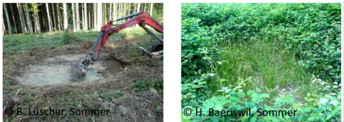
Abb. 6: Unkentümpel in der Gemeinde Lyss direkt nach dem Bau 2001 (links) und zwei Jahre später (rechts).

Auch der Pflegeaufwand ist im Verhältnis zur Gewässergrösse enorm. In den meisten Projekten mit natürlichen Gewässern wurde die Wasserfläche sehr schnell von hoher Vegetation überwuchert (Abb. 6); die regelmässige und gründliche Pflege bzw. Neugestaltung dieser Kleingewässer ist also elementar und sollte bereits vor dem Bau der Gewässer geplant werden!