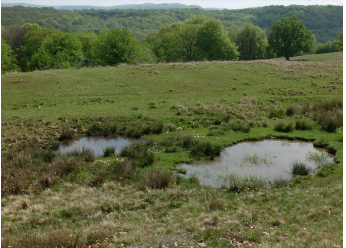
Abb. 7: Tümpel in einer Weide in Transsylvanien, Rumänien

variiert zeitlich stark und kann zu gewissen Zeiten sehr intensiv sein.