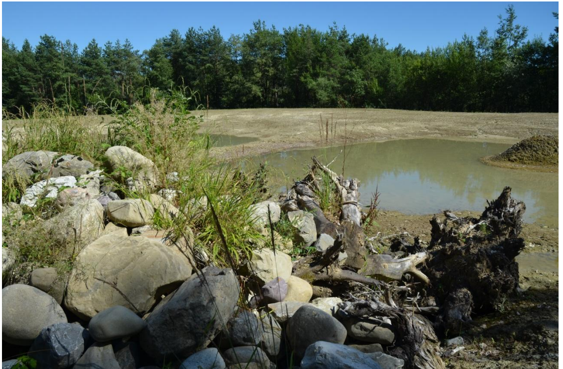
Abb. 6: Wurzelstöcke und Steinhaufen schaffen schattigen Unterschlupf in Gewässernähe, wo die Unken der Hitze ausweichen können

Nach Möglichkeit werden in unmittelbarer Umgebung der Fortpflanzungsgewässer auch Aufenthaltsgewässer angelegt, die durchaus permanent Wasser führen dürfen und etwas schattiger sind; in Gegenden mit Seefrosch-Vorkommen oder bei begrenztem Platz für die Massnahmen ist von Aufenthaltsgewässern abzusehen und es sind anderweitig kühle, feuchte Aufenthaltsmöglichkeiten (z.B. Asthaufen, Steinstrukturen ohne direkte Sonneneinstrahlung) für die adulten Unken zu schaffen.