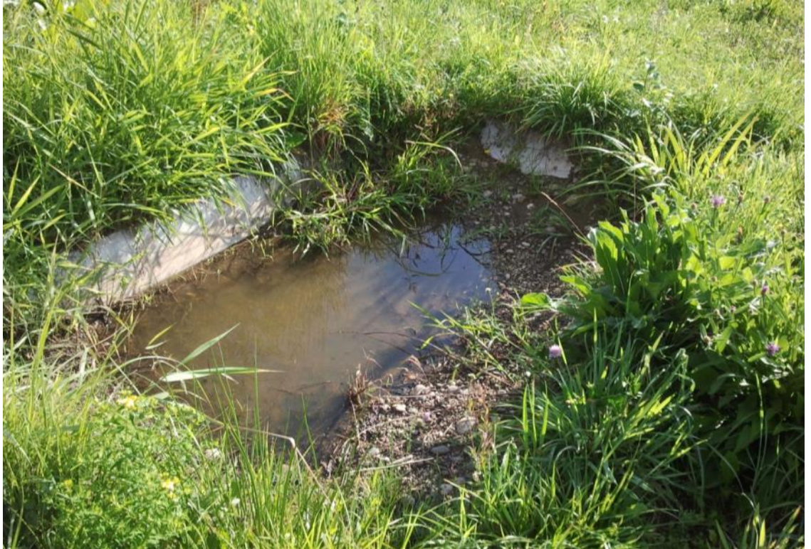
Abb. 8: halbleere Wanne mit Ausstiegsmöglichkeit durch Kiesaufschüttung an der rechten Längsseite.

flacher Ausstieg oder eine Ausstiegshilfe vorhanden ist (Abb. 8). Wannen sind an sich bereits umstritten als Naturschutzmassnahme; ertrunkene Kleinsäuger würden das Image noch weiter schädigen.