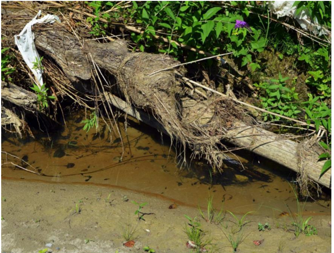
Abb. 2: Kaulquappen in einem Tümpel in der Flussaue der Goldach, SG.

Ursprünglich bewohnte die Gelbbauchunke vermutlich zu einem Grossteil Flussaue. Sie nutzte die darin bei Hochwassern neu entstehenden Tümpel am Rand des Flussbetts (Abb. 2), oder aber ausgewaschene Felskolke als Laichgewässer. Zufließende Hangwasser und Rinnsale können auch zu geeigneten Tümpellandschaften neben dem Hauptfluss führen. Die Tümpel sind meist relativ flach, können unterschiedlich gross sein, sind aber immer vom Fluss abgeschnitten, so dass sie sich stark erwärmen und frei von Fischen und anderen Fressräubern sind. Auen von kleinen Bächen, Rinnsale, sowie lehmige Rutschhänge und periodisch überschwemmte Flächen dienten ebenfalls als Primärlebensraum.